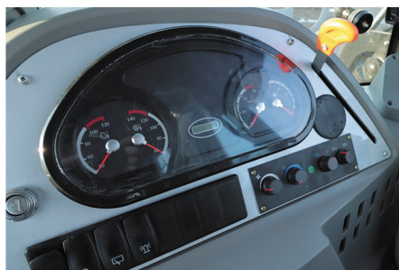
Информативный пульт управления; Кондиционер