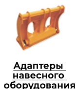
Адаптеры навесного оборудования