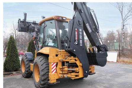
Телескопическая рукоять, двухходовая гидроразводка, гидравлич. смещение каретки