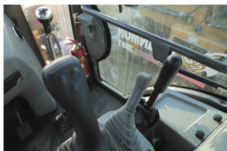
Удобное джойстиковое управление погрузочным и экскаваторным оборудованием